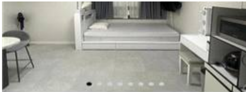
[직거래플랫폼 내 실제 광고 화면]