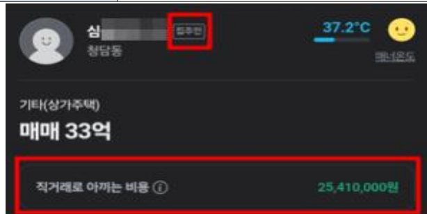
[직거래플랫폼 내 실제 광고 화면]